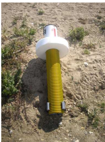
Bouée repère PMT