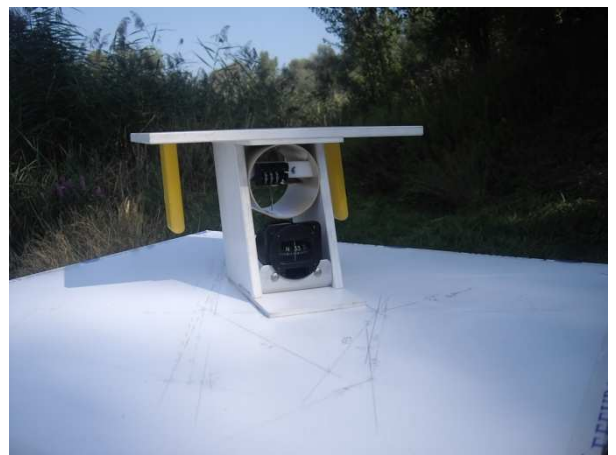
Planchette d'orientation PMT